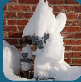
MEDIDOR SIN PROTECCIÓN PARA NIEVE