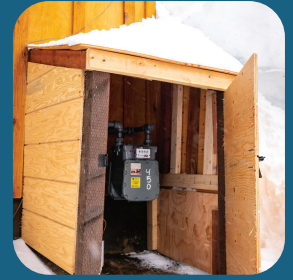
MEDIDOR CON PROTECCIÓN PARA NIEVE

La nieve y el hielo pesados que caen de los techos pueden dañar los medidores, los reguladores, y la tubería de gas natural relacionada. Se debe tener cuidado especial cuando se limpian los techos para evitar un impacto. También, la acumulación de nieve y hielo, ya sea natural o artificial, puede dañar los medidores de gas y los aparatos exteriores, y así crear una fuga peligrosa.